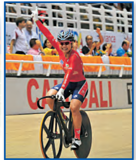
▲奧運銅牌得主李慧詩於10月在哥倫比亞舉行的世界盃場地賽首站再取得個人突破，在女子爭先賽摘金牌，首奪世界盃賽事冠軍。