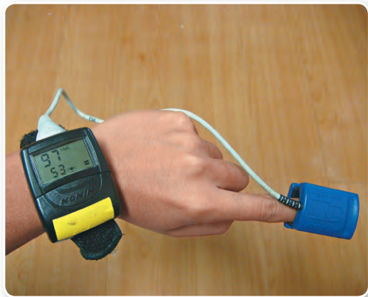
為運動員定期量度血氧飽和度，監察其生理反應。