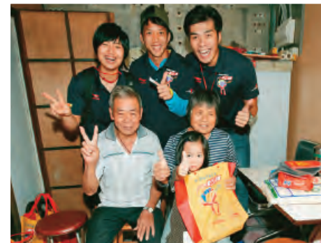
▲精英運動員於各區探訪長者，向他們送上祝福。