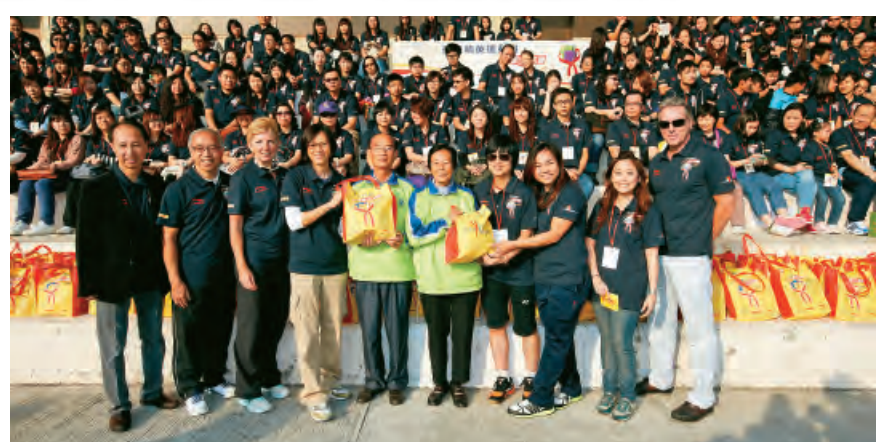
▲多名嘉賓及精英運動員於出發儀式向長者送贈福袋。

參與運動員均表示活動別具意義，既可為長者帶來歡樂和溫暖，又可向社區傳遞關愛的訊息，值得大家繼續支持。