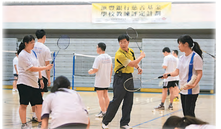
羽毛球教練在專項運動課程中教授一眾老師羽毛球的訓練技巧。

學校教練評定計劃是香港教練培訓計劃中重要一環，旨在讓負責校隊及聯課活動的中、小學老師，特別是體育科老師，接受運動專項的教練培訓，並考取「認可學校教練」資格。計劃自推出至今已逾2,400位老師參加，為校園體育培訓提供強大後盾。