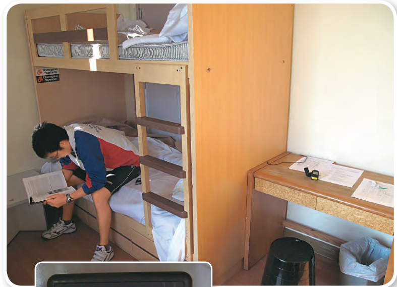
體院利用儀器製造出低氧密室，供精英運動員居住。