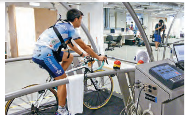
▲研討會探討科研技術在提升運動表現方面的發展和應用。

一年一度由體院主辦的國際科學研討會將於2013年3月15至16日(星期五及六)在香港舉行，主題為「提升運動表現的新興科技」。研討會的目的是讓教練、體育教師、運動員、運動科學及醫學的科研人員，以及體育行政人員互相交流知識，探討科研技術在提升運動表現方面的發展和應用。有關研討會議程及註冊資料，請瀏覽網頁： http://www.hksi.org.hk/iss ，或聯絡研討會秘書處(電話：2681 6130；電郵： iss@hksi.org.hk )。