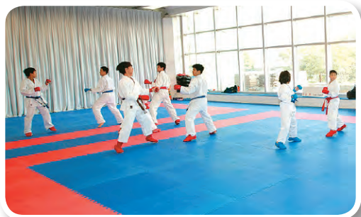
▲鄺教練希望能盡早選拔有潛質的運動員投入精英訓練，提升香港空手道運動的整體水平。

對於有數十年訓練經驗的鄺教練來說，香港的空手道發展是很具優勢的，因為這裡可以融合東西方兩大主流打法，在知己知彼的情況下，面對一些堅持東方打法的傳統亞洲強國時，會有一定的優勢。為了讓香港的空手道運動能有長遠的發展，在中國香港空手道總會大力支持下，鄺教練正主導一項青少年運動員培育計劃，希望在小學階段開始選拔一些有潛質的運動員，讓他們盡早投入精英訓練系統。鄺教練認為，運動員越早投入訓練，就能越早培養出精英運動員的心志和體格，而且有些時間用來外出比賽汲取經驗，對提升香港空手道水平、衝出亞洲，意義重大。