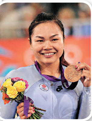
▲李慧詩勇奪倫敦女子凱琳賽銅牌，為香港單車史寫下新一頁。

李慧詩在倫敦奧運會為香港締造歷史，勇奪場地單車女子凱琳賽銅牌，亦是香港第三面奧運獎牌。在比賽之前，李慧詩一直被視為香港的獎牌希望，然而在凱琳賽初賽中，她只取得第四名，要靠復活賽晉級。李慧詩在復活賽中沒有被之前初賽失利所影響，主動以其強力的衝刺搶攻，最後以首名衝線。在複賽時，她搶先佔領頭車位置，後來曾一度跌落第四位，但最終以第三名衝線殺入決賽，並一舉贏得銅牌。 李慧詩表示：「第一次參加奧運會使我親身感受到強調互相了解、友誼、團結和公平競爭的奧林匹克精神。這面奧運銅牌得來不易，是集各方努力的成果，同時也證明了香港運動員的實力。我深信在奧運會中取得的經驗，將有助我將來競逐大型運動會時，有更好的發揮。」