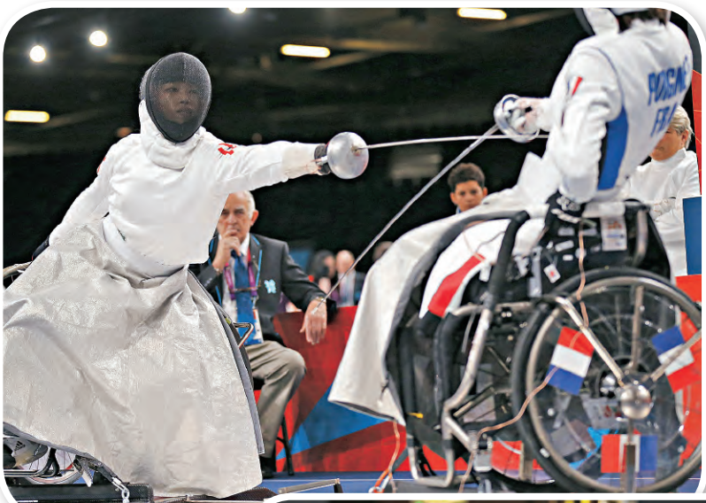
▲余翠怡在殘奧女子花劍和重劍個人A級項目個人獨取2金。