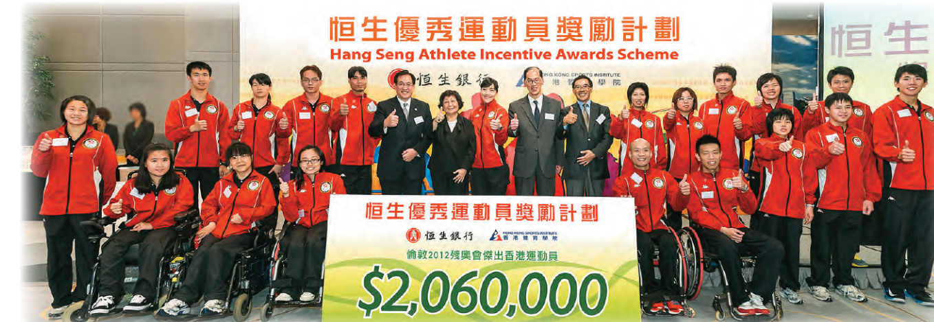
▲出戰倫敦殘奧會的香港運動員獲頒共206萬港元的獎勵。頒獎典禮的主禮嘉賓包括唐家成先生JP（後排右六）、李慧敏女士（後排左六）、曾德成先生GBS JP（後排右七），以及香港殘疾人奧委會暨傷殘人士體育協會會長周一嶽醫生GBS MBE JP（後排左五）。