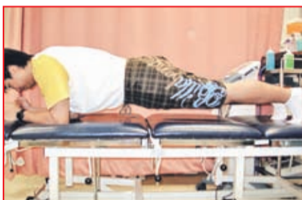
▲加強腰腹核心的鞏固能力 ▲減輕椎間盤後突的情況，並有效地活動腰部的關節。