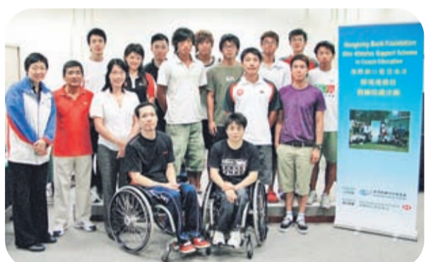
▲今年有15名運動員參加，為未來的教練事業作好準備。