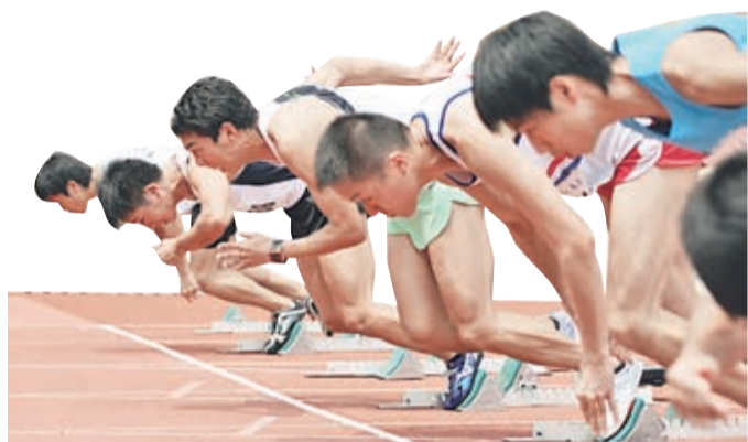
▲港隊精英盡出，期待在東亞運創造佳績。

從2009年7月起，體院的精英體育項目已由11個增至14個；三個新增項目是田徑、桌球及空手道。要成為精英體育項目，個別運動項目必須提交兩名成年及兩名青少年運動員的最佳成績，而該成績是按主要國際賽事計分表評分，平均分達9分或以上，才能達到成為精英體育項目的基準。精英體育項目為期四年，每兩年作出檢討。原有的11個精英體育項目是羽毛球、單車、劍擊、賽艇、壁球、游泳、乒乓球、保齡球、三項鐵人、滑浪風帆和武術。