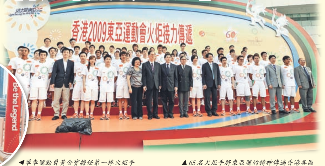
▲單車運動員黃金寶擔任第一棒火炬手

首次在香港舉行的東亞運動會備受各界注意，在距離開幕100日(即8月29日)進行了火炬接力傳遞，寓意全港市民「活力迎東亞」。65名火炬手中有23名是現役體院獎學金運動員，一同將東亞運的精神傳遞社區。火炬傳遞的路線由九龍公園廣場開始，經過尖沙咀鬧市，再由船載，最後以灣仔紫荊廣場為終點，全程約10公里，歷時兩小時完成。