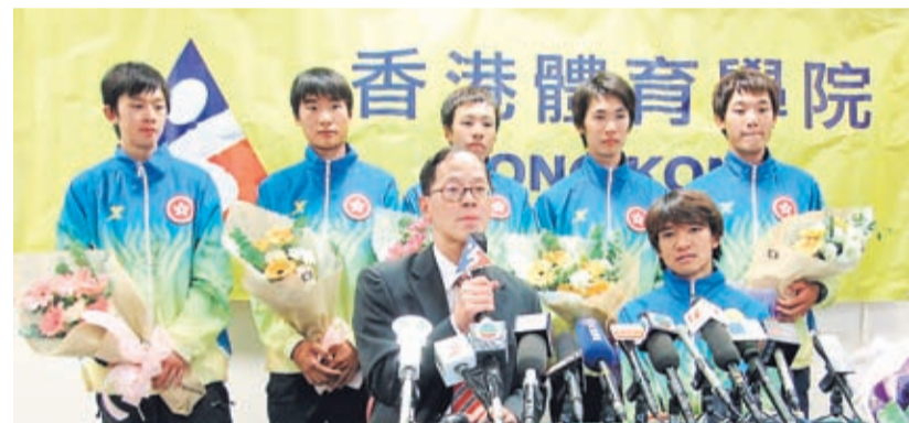
▲民政事務局長曾德成(前排左)恭賀各運動員

香港健兒在6至11月期間參加了多個國際運動會，取得優異成績。無論是精英運動員、青少年運動員或是殘障運動員均表現卓越，令人鼓舞。體院恭賀各運動員凱旋而歸，並希望他們在未來的賽事中繼續努力。