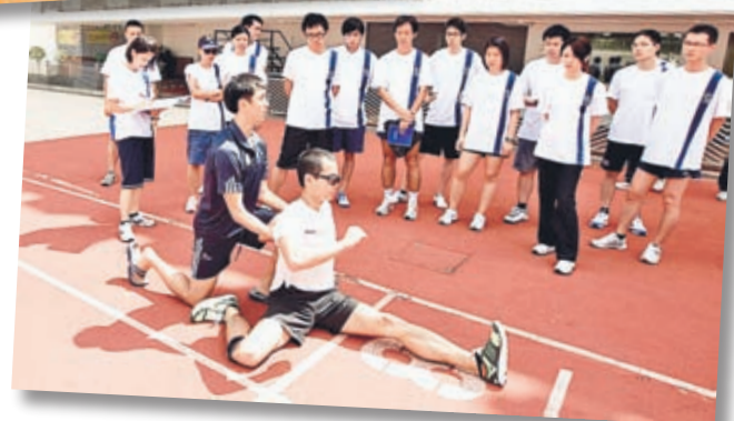
▲教師透過實習提升運動訓練的技術