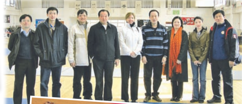
體院管理層及總教練在北京及上海為精英培訓進行技術交流