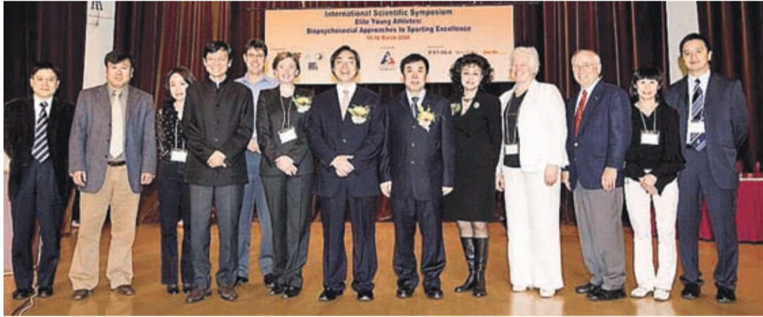
▲上一屆國際科學研討會吸引接近200名本地及海外體育人士參加

體院將於2009年3月21日在香港舉辦第四屆國際科學研討會，主題是「運動衣履如何提升精英運動員表現」。研討會將集合海外及本地專家，探討運動衣履在提升精英運動員表現方面所擔當的角色，以及香港的運動衣履設計與製造技術；屆時並會安排一個運動衣履展。我們誠邀閣下參加這次研討會。有興趣參加之人士，請瀏覽研討會網頁： http://www.hksi.org.hk/iss ，或與研討會秘書處聯絡，電話：2681 6130或電郵： iss@hksi.org.hk 。有興趣贊助之機構，請與公眾事務及市場拓展部鍾小姐聯絡，電話：2681 6532。