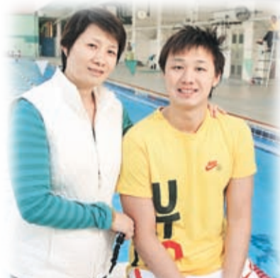
為國家隊首奪奧運男子游泳獎牌的張琳（右），在教練陳映紅（左）的陪同下來港與港隊同場練習。

張琳在香港逗留期間還保持每天練水，一方面保持狀態，另一方面舒緩傷患疲勞。他很高興成為第一位獲得奧運獎牌的中國男泳手，並認為以輕鬆的心情參加不同大賽，才能發揮最佳實力。張琳會以2009年的全國運動會、東亞運動會及2010年的亞運會作目標，希望取得好成績。他鼓勵香港泳手只要努力付出，必定有所回報。