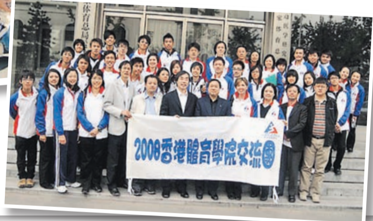
體院於北京奧運會後安排26名精英運動員拜訪及參觀多個國家體育組織及奧運場地，包括國家體育總局體育醫院及有「鳥巢」之稱的北京國家體育場。