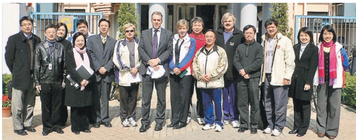
民政事務局副秘書長麥敬年（左八）於1月在體院管理層及總教練的陪同下，參觀體院位於烏溪沙的臨時總部，了解體院的日常運作及精英運動員的訓練情況。