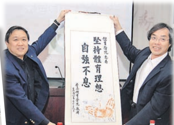
陳啟明教授（右）向國家體育總局體育醫院院長李國平教授（左）致送紀念品