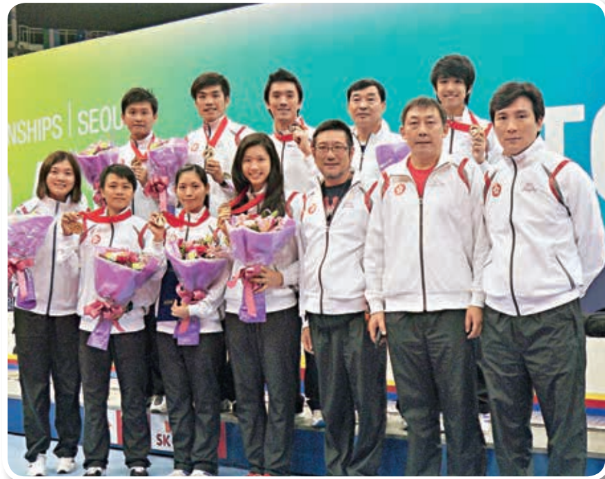
▲康教練於去年7月的亞洲劍擊錦標賽帶領港隊取得4面銅牌的佳績。