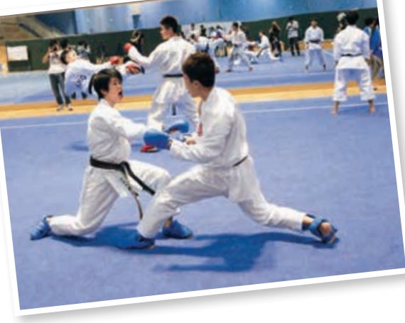
▲▲體院於2012至13年度發放予運動員的現金直接資助將大幅增加超過10%。