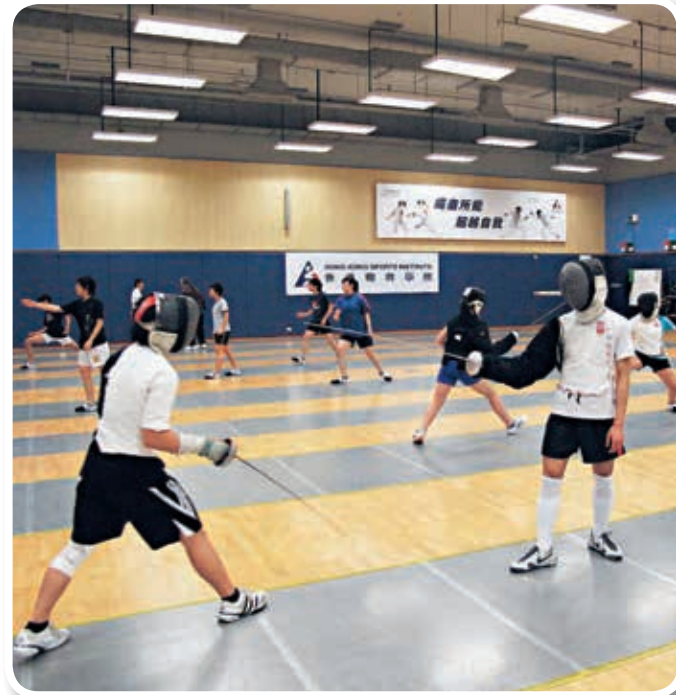
▲康教練現時協助培訓約100名精英運動員，希望能透過有效的管理和資源分配來提升訓練效果。