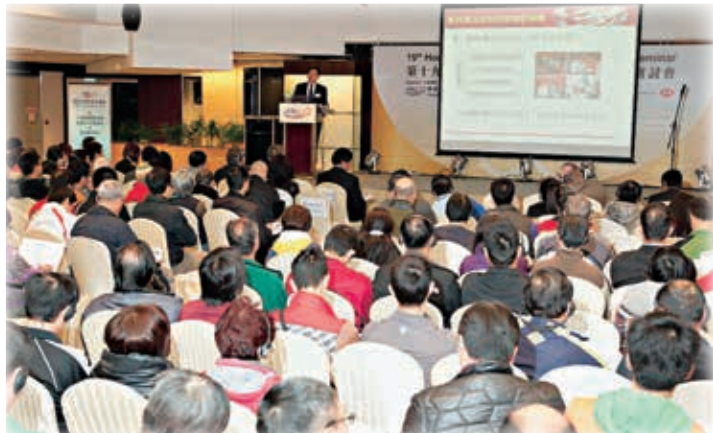
▲今屆研討會破紀錄吸引逾250名教練參加。