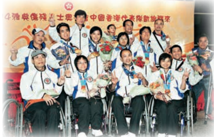
▲香港輪椅劍擊隊於2004年的雅典傷殘人士奧運會中取得8面金牌的輝煌成績，令康教練印象難忘。