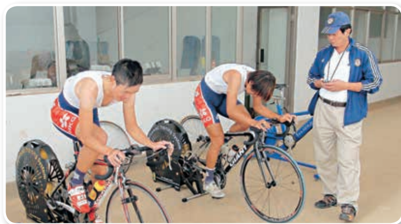
▲體院教練及運動生物力學專家以 SRM 及 WATTBIKE 訓練儀器為運動員進行生物力學監控。